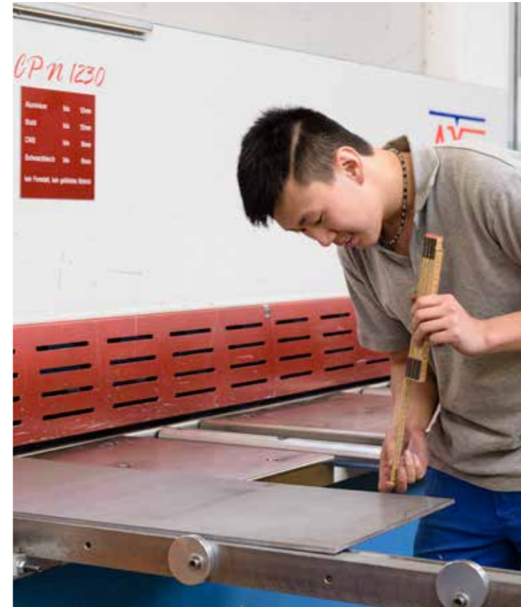
Travail de la tôle L'aide-constructeur métallique met en forme et dimensionne les tôles à l'aide de presses plieuses et de machines de cintrage.