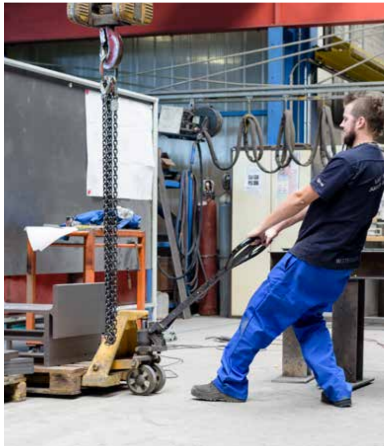
Montage Les éléments métalliques sont prêts pour le montage. Si les pièces métalliques sont lourdes, l'aide-constructeur métallique utilise des outils de levage.