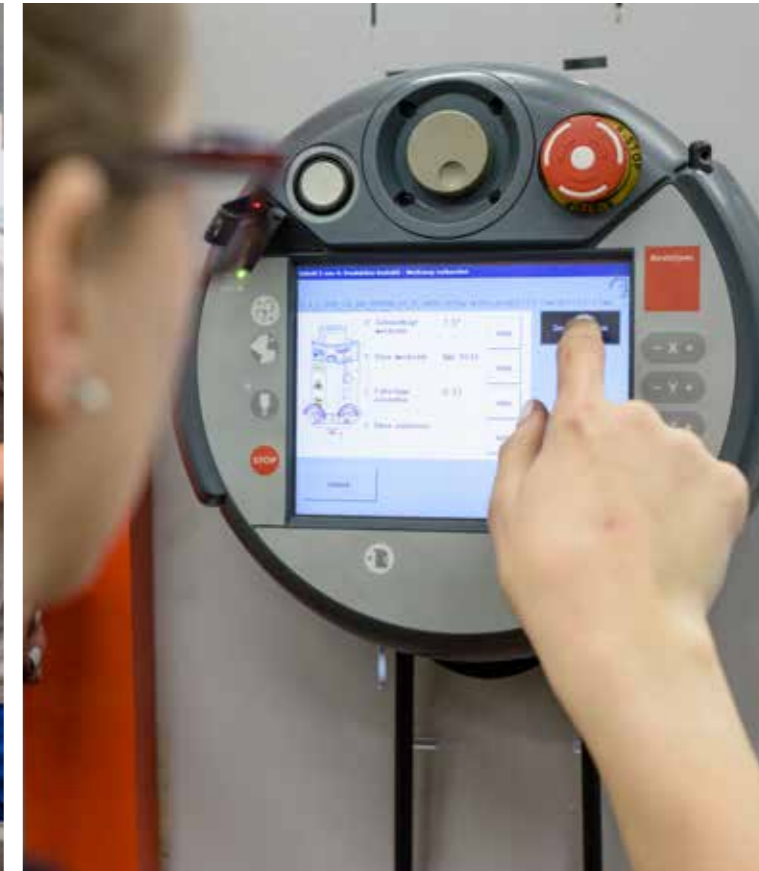
Préparation des travaux sur la machine Pour que les tôles présentent les bonnes dimensions au millimètre près, l'aide-constructeur métallique les découpe à l'aide de machines laser.