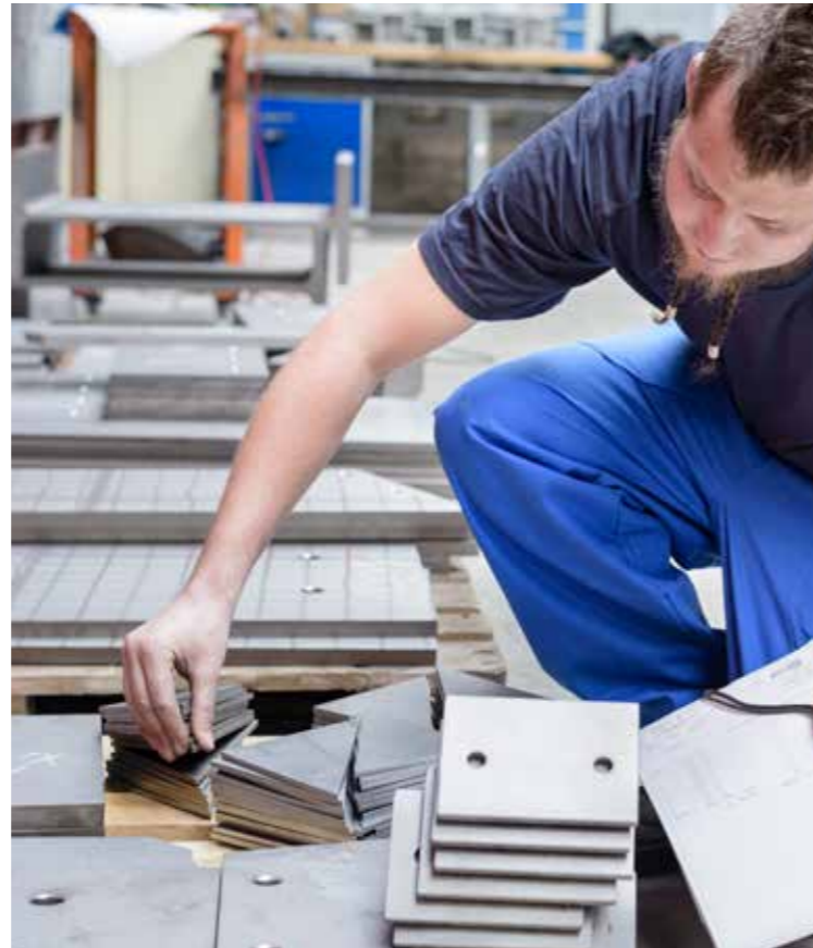
Assemblage L'aide-constructeur métallique contrôle le nombre de pièces au moyen de la liste de pièces. Cela garantit le bon déroulement de l'assemblage.