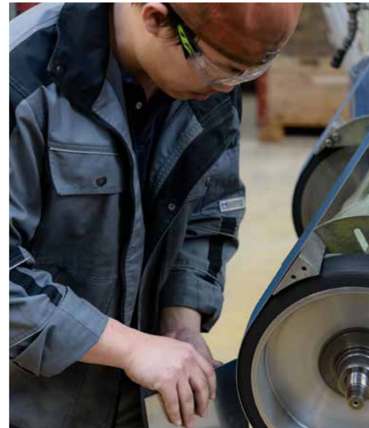
Sécurité Les différentes pièces réalisées sont ponçées avant l'assemblage et débarrassées de leurs arêtes vives afin d'éliminer tout risque d'accident de captures pendant le travail.