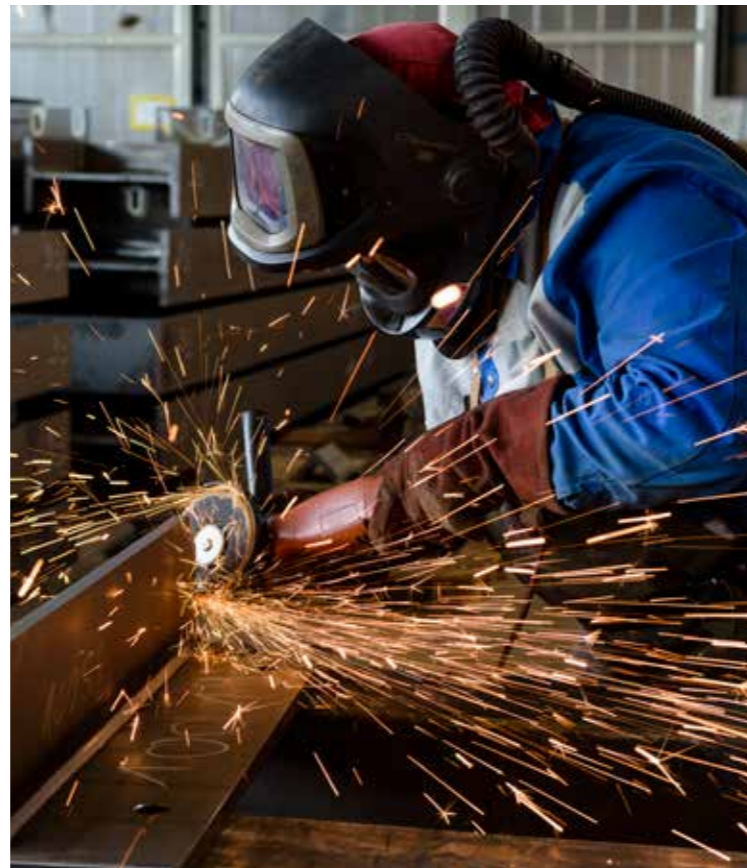
Ponçage et ajustage Après le soudage, les éléments métalliques sont mesurés, ajustés, puis finalement ponçés proprement.