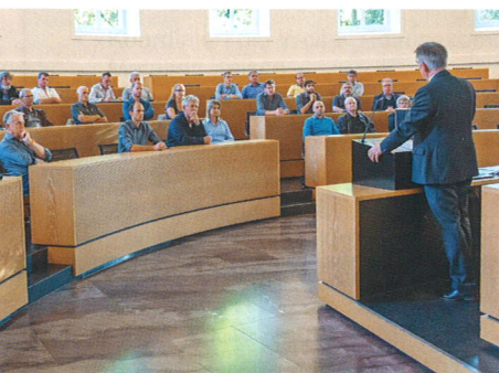
Regierungsrat Alex Hürzeler, Vorsteher des Departements Bildung, Kultur und Sport, spricht zu den Mitgliedern des Metaltec Aargau.

Normalerweise sind es die Vertreter der Aargauer Bevölkerung, die sich auf die im Halbkreis angeordneten Stühle im Aarauer Grossratssaal setzen und über politische Geschäfte abstimmen. Am 16. Oktober waren es jedoch rund 50 Vertreter der Aargauer Metall- und Stahlbaubranche, die im Halbrund Platz genommen haben. Sie erhielten zwar einen Crashkurs zum politischen Alltag und den Sitzungsabläufen im Grossratsgebäude, doch die Abstimmungsknöpfe im Grossratssaal durften sie nicht betätigen.